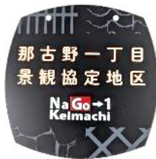
プレート 15cm×15cm 樹脂二層板 1.5mm厚